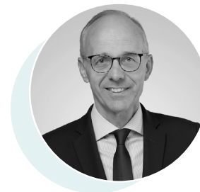
Luc Frieden